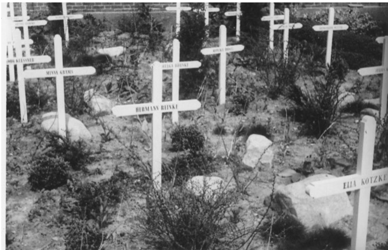
62 tyske flygtninge døde på Ryslinge Højskole